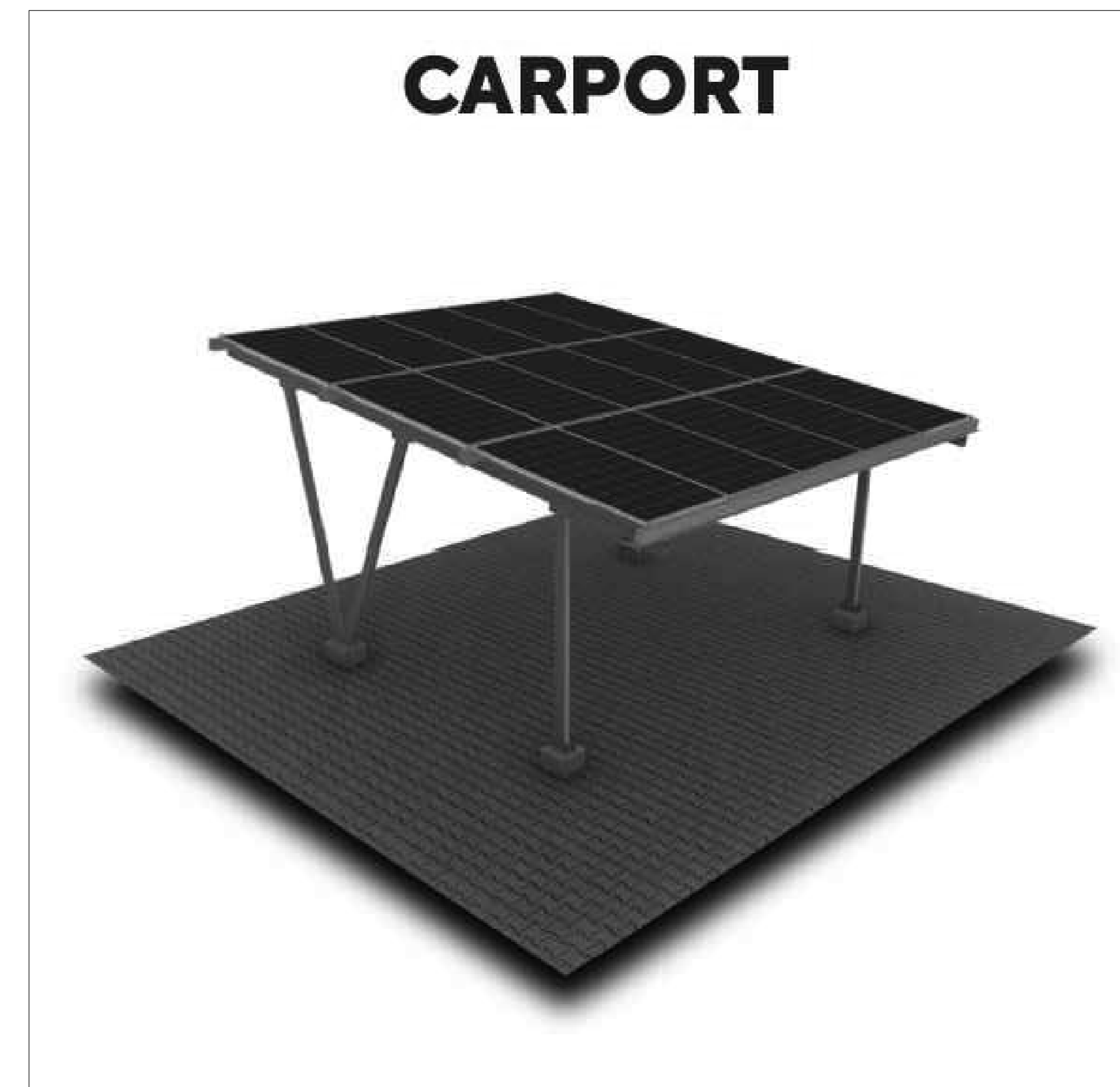
MODELO SIMILAR ESPERADO ESTRUTURA METÁLICA CARPORT