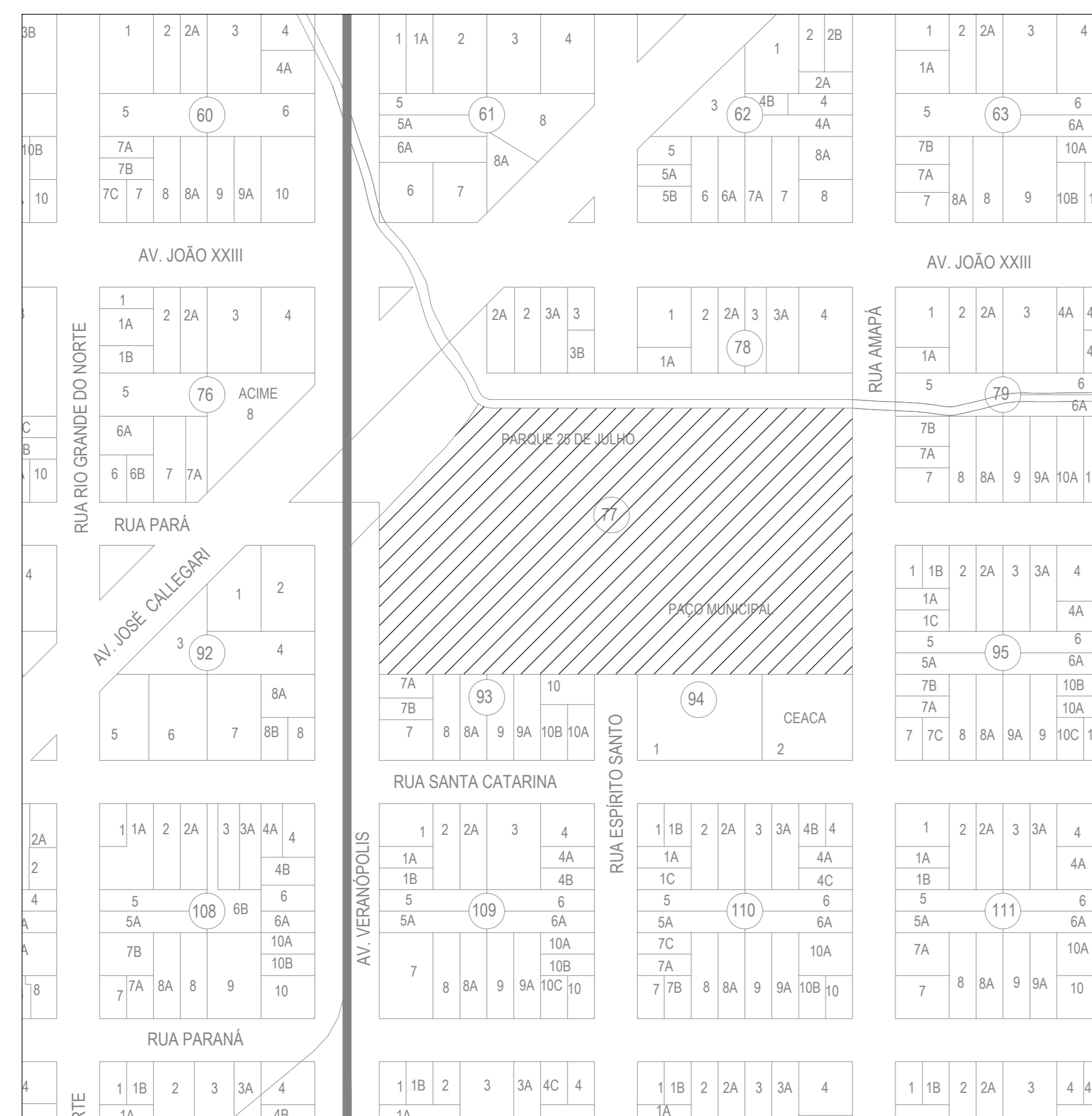
PLANTA DE LOCALIZAÇÃO Escala 1:5000